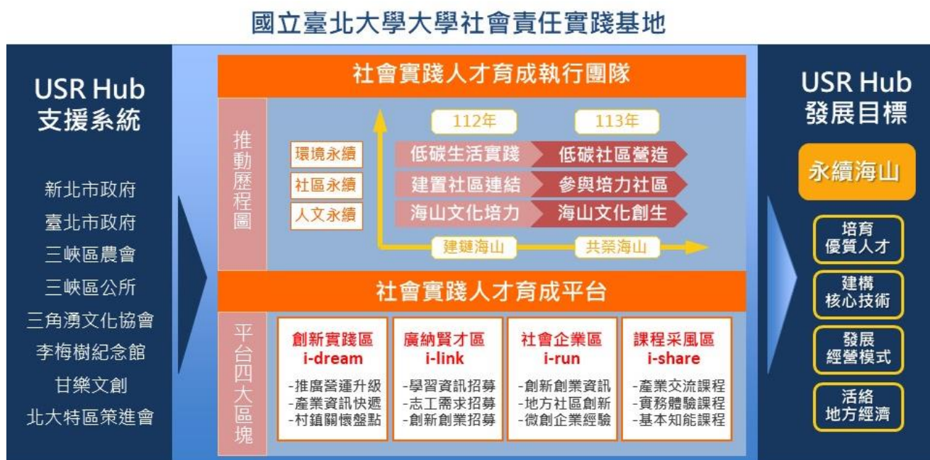
本校校級大學社會責任實踐基地(USR Hub,i-Can)永續運作之基礎推動架構圖

組織與資源，形成校內 USR 實踐場域與基地，作為永續經營的基礎。除現有校級 永續 辦公室之外，另包括 四 個 USR 計畫運作基地，分別為「校級研究中心-海山學研究中心」、「非營利組織-社團法人臺灣鳶山社會實踐協會」、「院級研究中心- 高齡與社區研究中心 」以及「 校級研究中心-全球變遷與永續科學研究中心 」。更進一步形成支持校級大學社會責任實踐基地(USR Hub,i-Can)永續運作之基礎推動架構（請見次頁圖示）。